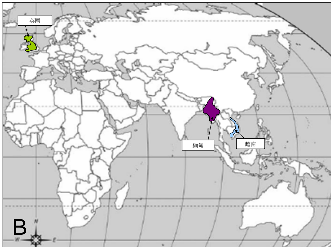
(A) 自 2004 年 1 月起人類感染 H5N1 禽流感的情況(截至 2007 年 11 月 17 日) 及 (B) 於 2007 年 10 月 17 日至 2007 年 11 月 17 日期間鳥類間爆發禽流感的情況。

禽流感疫情週報 是由衛生防護中心呼吸疾病辦事處於啓動流感爆發應變計劃中的戒備應變級別時，每星期出版的報告。本報告目的是報告一些國際上有關禽流感應變及控制的重要發展及監察全球禽流感在人類及鳥類間的活動。