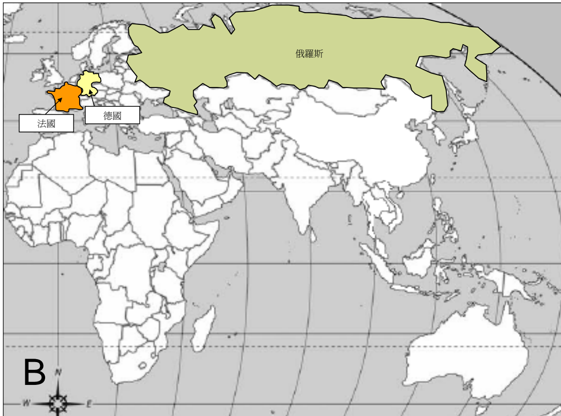
(A) 自 2004 年 1 月起人類感染 H5N1 禽流感的情況(截至 2007 年 9 月 8 日) 及 (B) 於 2007 年 8 月 8 日至 2007 年 9 月 8 日期間鳥類間爆發禽流感的情況。

禽流感疫情週報 是由衛生防護中心呼吸疾病辦事處於啓動流感爆發應變計劃中的戒備應變級別時，每星期出版的報告。本報告目的是報告一些國際上有關禽流感應變及控制的重要發展及監察全球禽流感在人類及鳥類間的活動。