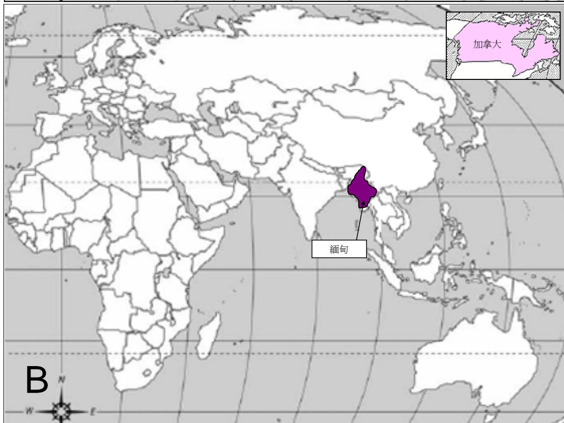
(A) 自 2004 年 1 月起人類感染 H5N1 禽流感的情況(截至 2007 年 11 月 10 日) 及 (B) 於 2007 年 10 月 10 日至 2007 年 11 月 10 日期間鳥類間爆發禽流感的情況。

禽流感疫情週報 是由衛生防護中心呼吸疾病辦事處於啓動流感爆發應變計劃中的戒備應變級別時，每星期出版的報告。本報告目的是報告一些國際上有關禽流感應變及控制的重要發展及監察全球禽流感在人類及鳥類間的活動。