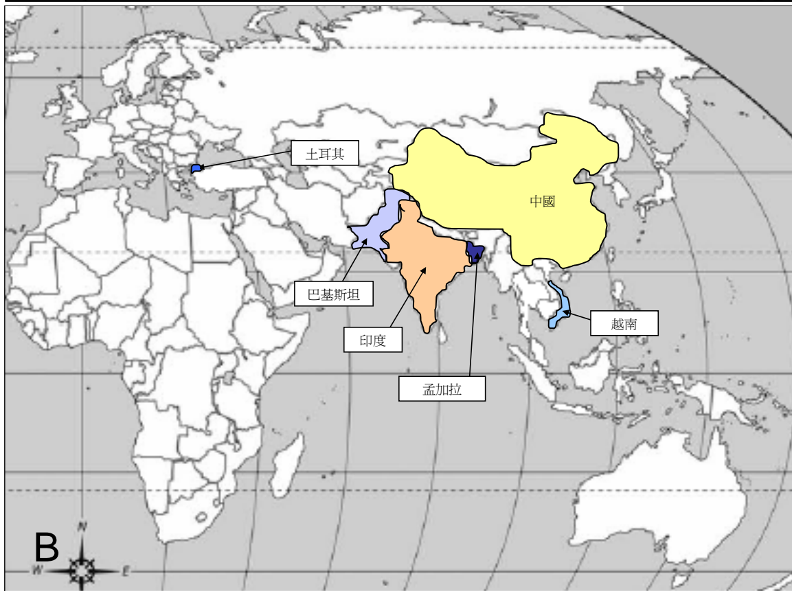
(A) 自 2004 年 1 月起人類感染 H5N1 禽流感的情況(截至 2008 年 3 月 29 日) 及 (B) 於 2008 年 2 月 29 日至 2008 年 3 月 29 日期間鳥類間爆發禽流感的情況。

禽流感疫情週報 是由衛生防護中心呼吸疾病辦事處於啓動流感爆發應變計劃中的戒備應變級別時，每星期出版的報告。本報告目的是報告一些國際上有關禽流感應變及控制的重要發展及監察全球禽流感在人類及鳥類間的活動。