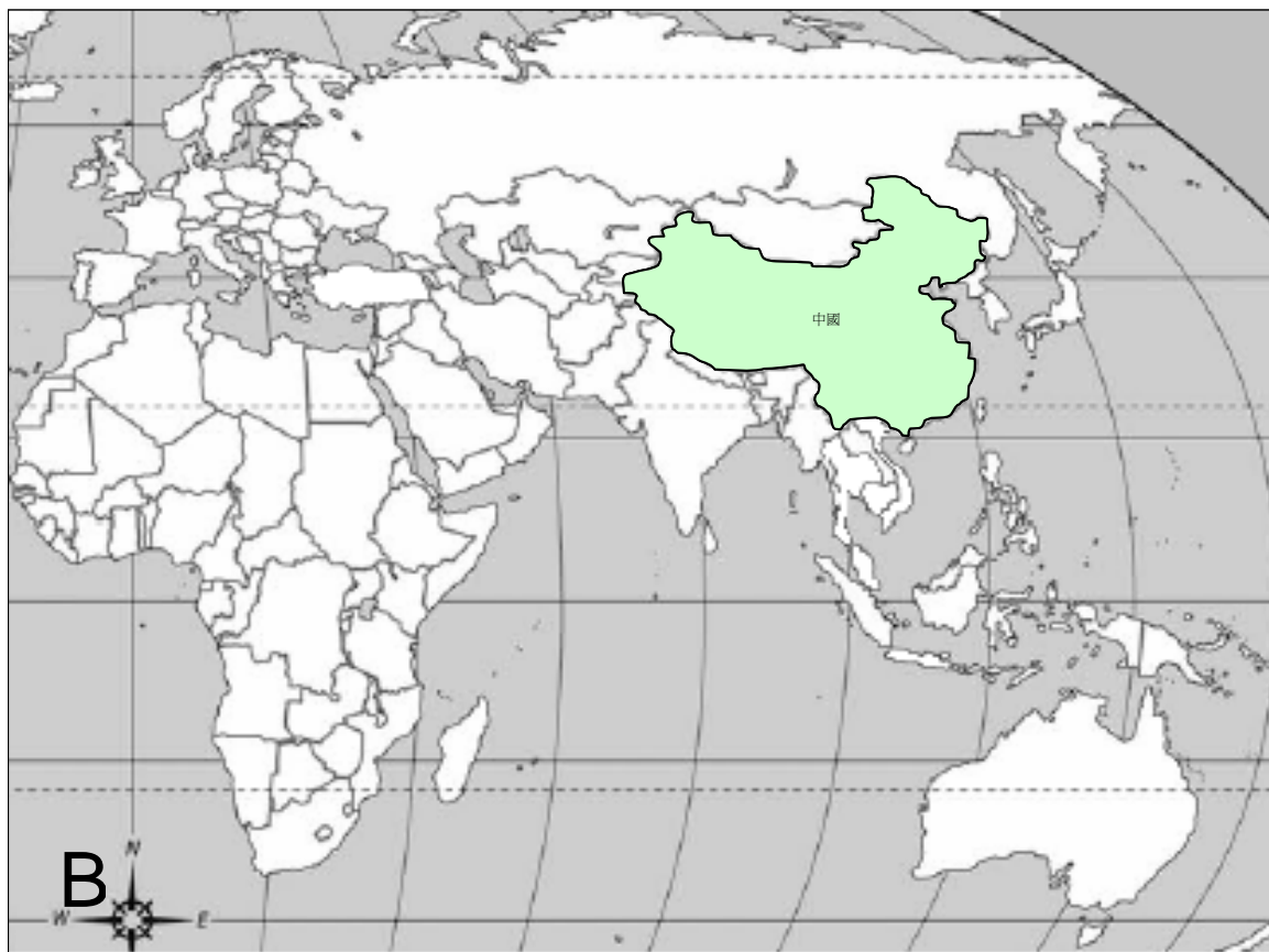
A) 自 2004 年 1 月起於亞洲地區人類感染 H5N1 禽流感的情況(截至 2006 年 11 月 4 日) 及 B) 於 2006 年 10 月 4 日至 2006 年 11 月 4 日期間動物間爆發禽流感的情況。

禽流感疫情週報 是由衛生防護中心呼吸疾病辦事處於啓動流感爆發應變計劃中的戒備應變級別時，每星期出版的報告。本報告目的是報告一些國際上有關禽流感應變及控制的重要發展及監察全球禽流感在人類及鳥類間的活動。