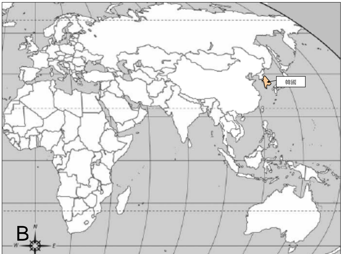
A) 自 2004 年 1 月起於亞洲地區人類感染 H5N1 禽流感的情況(截至 2006 年 11 月 25 日) 及 B) 於 2006 年 10 月 25 日至 2006 年 11 月 25 日期間動物間爆發禽流感的情況。

禽流感疫情週報 是由衛生防護中心呼吸疾病辦事處於啟動流感爆發應變計劃中的戒備應變級別時，每星期出版的報告。本報告目的是報告一些國際上有關禽流感應變及控制的重要發展及監察全球禽流感在人類及鳥類間的活動。