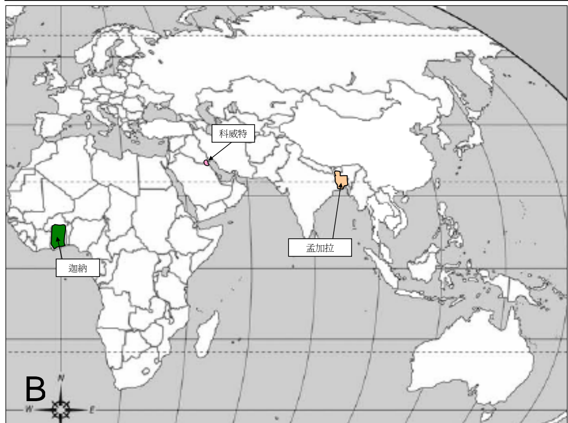
(A) 自 2004 年 1 月起人類感染 H5N1 禽流感的情況(截至 2007 年 5 月 12 日) 及 (B) 於 2007 年 4 月 12 日至 2007 年 5 月 12 日期間鳥類間爆發禽流感的情況。

禽流感疫情週報 是由衛生防護中心呼吸疾病辦事處於啓動流感爆發應變計劃中的戒備應變級別時，每星期出版的報告。本報告目的是報告一些國際上有關禽流感應變及控制的重要發展及監察全球禽流感在人類及鳥類間的活動。