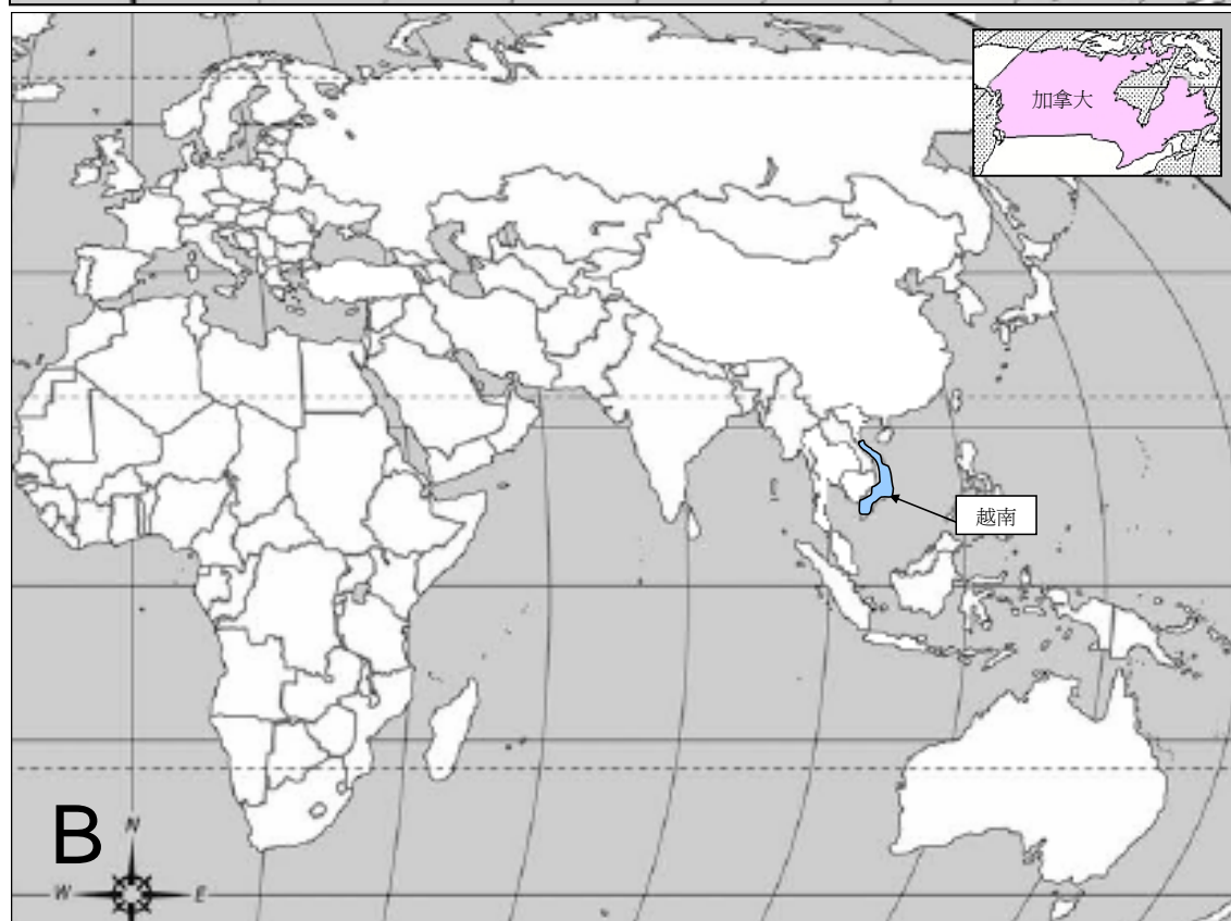
(A) 自 2004 年 1 月起人類感染 H5N1 禽流感的情況(截至 2007 年 10 月 20 日) 及 (B) 於 2007 年 9 月 20 日至 2007 年 10 月 20 日期間鳥類間爆發禽流感的情況。

禽流感疫情週報 是由衛生防護中心呼吸疾病辦事處於啟動流感爆發應變計劃中的戒備應變級別時，每星期出版的報告。本報告目的是報告一些國際上有關禽流感應變及控制的重要發展及監察全球禽流感在人類及鳥類間的活動。