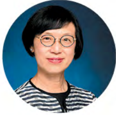
陳肇始教授，JP 食物及衛生局局長

癌 症是香港的頭號殺手。在過去五年，每日平均有超過 35 人被癌症奪去寶貴生命。隨着人口增長和老化，我們相信癌症的新增個案數目和相關的醫療負擔將會增加。然而，在 1981 至 2018 年期間，整體癌症的年齡標準化死亡率於初期維持穩定，之後更逐漸下降。事實上，隨着醫療科技的進步，癌症得以及早診斷和採取更有效的治療，而透過改變生活方式亦有助預防部分癌症。