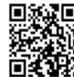
"List of Vaccination Subsidy Scheme Participating Doctors"

Under the Vaccination Subsidy Scheme (VSS) of DH, children who are Hong Kong residents are eligible to receive SIV, with Government subsidy, from private doctors enrolled in VSS. Doctors participating in VSS may or may not charge a service fee. Please refer to the "List of Participating Doctors" to see whether the individual doctor charges service fee, the amount they charge and their address ( https://apps.hcv.gov.hk/SDIR/EN/index.aspx ).