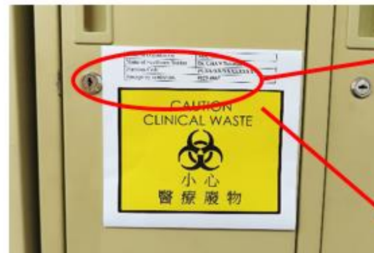
圖例三：醫療廢物貯存櫃上的標籤及警告標示示例