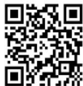
「參與「疫苗資助計劃」醫生名單」

衛生署的「疫苗資助計劃」下，有香港居民身份的兒童，可前往參與計劃的私家醫生診所接種獲政府資助的流感疫苗。參與計劃醫生可能收取或不收取服務費。家長可從「參與計劃醫生名單」( https://apps.hcv.gov.hk/SDIR/Zh/index.aspx ) 中，參閱個別醫生會否收取服務費，收費水平及其診所地址。