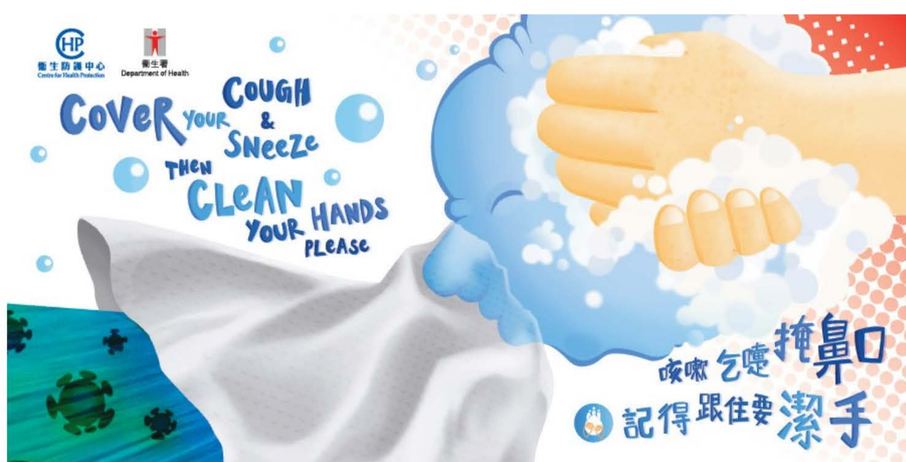
咳嗽乞嚏掩鼻口 记得跟住要洁手

面对2019冠状病毒病大流行，家长除了时刻保持个人和环境卫生，亦应以身作则，让孩子养成好习惯，预防感染和减低传播病毒的风险。2019冠状病毒病主要经由呼吸道飞沫或接触传播，卫生署卫生防护中心今年以「咳嗽乞嚏掩鼻口 记得跟住要洁手」作为5月5日手部卫生日的主题，提醒大家咳嗽礼仪和保持手部卫生，是简单而有效的防感染方法。