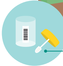
මල සාම්පල එකතු කිරීමේ හැන්දූ