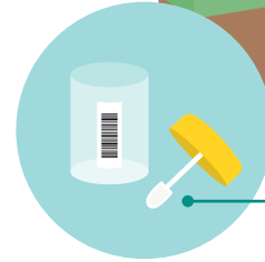
ช้อนเก็บตัวอย่าง