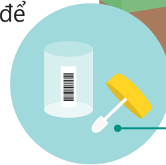
thìa lấy mẫu bệnh phẩm