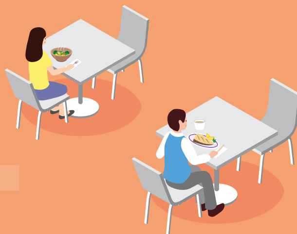
桌子之間留有足夠空間