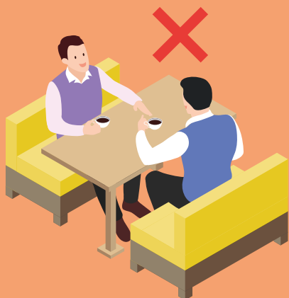
減少直接面對面接觸