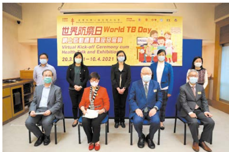
■ 「世界防癆日」網上啟動儀式主禮嘉賓和主要工作人員合照。

現時全港設有17間胸肺科診所，為結核病患者提供免費診斷和治療服務，並為病人的緊密接觸者進行篩查，積極預防及控制結核病。