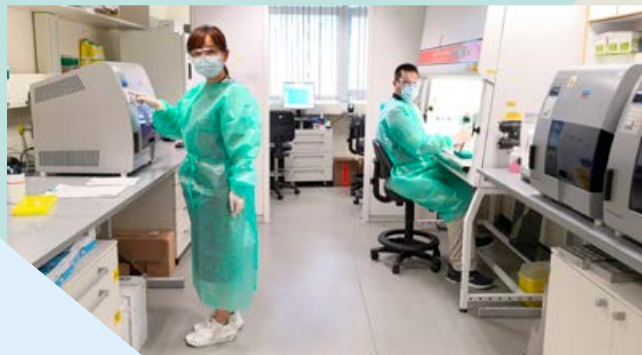
■ 為監測變種病毒株的傳播情況，公共衛生化驗服務處同事會進行單一核苷酸多型性 PCR 及基因排序。

衛生署每一名同事一直不辭勞苦、日以繼夜辛勤工作，推動「外防輸入、內防擴散」措施、疫苗接種以至健康宣傳等，以致疫情得以穩定下來。每位同事繼續謹守崗位之餘，期望能推動更多市民及早接種疫苗，讓香港可盡快脫離疫症，重回正軌。🇭🇰