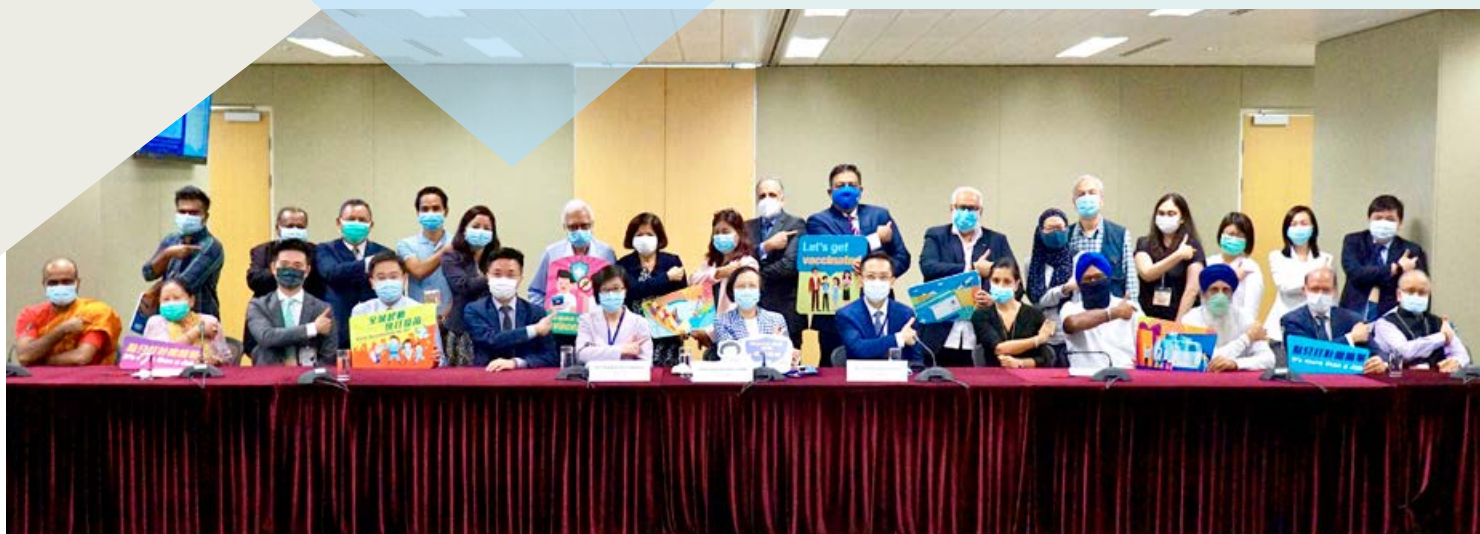
■ 陳肇始教授（前排中）、陳漢儀醫生（前排左六）、林文健醫生（前排右六）與少數族裔團體代表會面，聆聽他們的看法及商討如何鼓勵更多人接種疫苗。