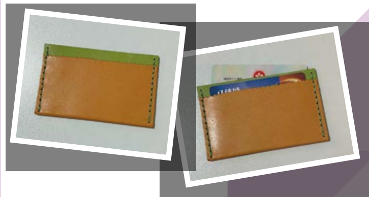
■ 參加者製作的皮革卡片套作品。

「DIY 皮革工藝坊」教導同事如何縫製出獨一無二的皮革卡片套。導師透過網上課程向參加者介紹不同皮革材料的分別及製作工具的用法，講述製作皮革工藝品的原理和技巧。參加者所製作的皮革卡片套既美觀又實用。而「擴香石工作坊」則讓同事體驗如何親手製作擴香石。導師細心講解有關擴香石的原理及製作技巧，並親自示範製作步驟，指導各參加者設計出個人專屬的藝術作品。