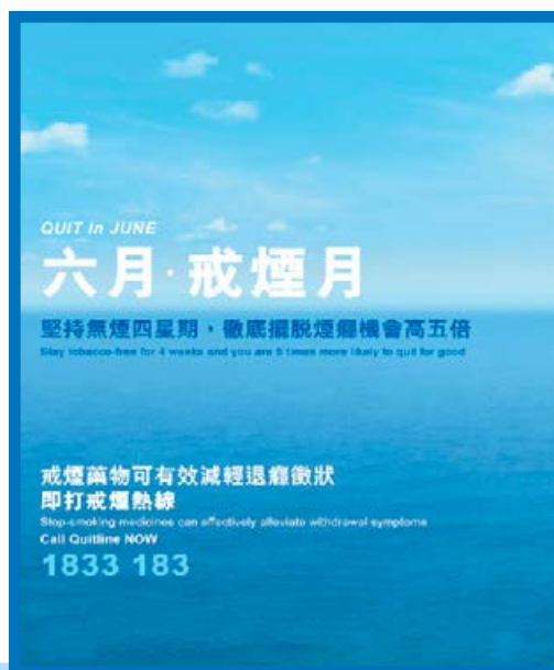
■「六月·戒煙月」宣傳海報。

在 疫情期間，吸煙人士可透過「寄住戒」服務進行居家戒煙，亦可致電戒煙熱線1833 183或登入戒煙專題網頁獲取戒煙資訊；而醫護人員則可以在戒煙專題網頁下載一系列網上資源以及參加「極簡短戒煙建議」網上課程等，協助吸煙人士戒煙。