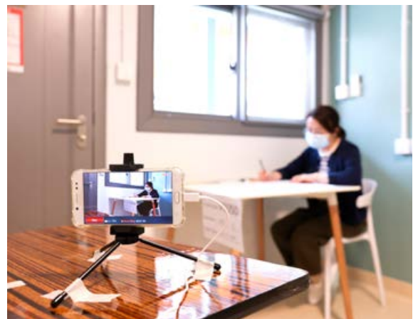
■ 檢疫中心設置特別安排，讓考生應考文憑試。