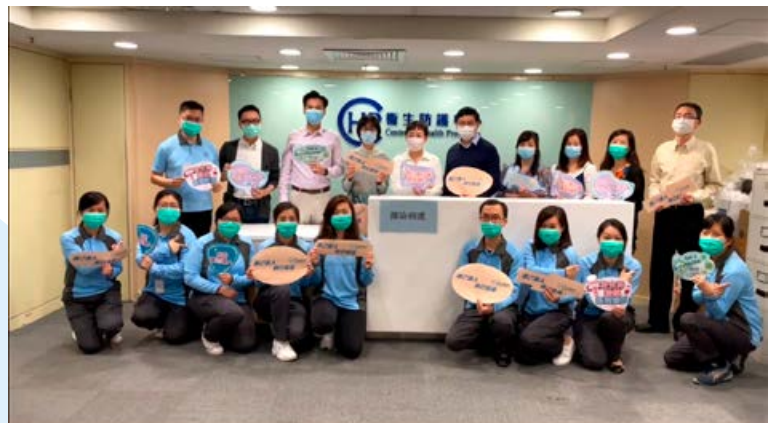
■ 衛生署各部門同事拍攝短片及創作口號，呼籲接種新冠疫苗。