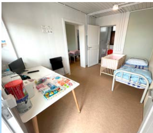
■ 檢疫中心提供嬰兒床及其他幼兒所需用品。

衛生署十分着重檢疫中心的食物安全及質素，在審視食物招標、物流配送、飯餐分發等方面後，於 5 月下旬起採用國泰航空作膳食供應商。中心亦正進行改建工程，提供更多可供檢疫家庭使用的房間。