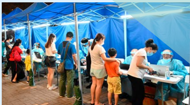
■ 衛生署配合政府其他部門多次採取迅速、嚴厲的圍封強制檢測及檢疫行動，務求切斷病毒傳播鏈。