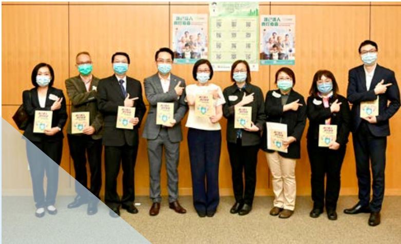
■ 衛生署署長陳漢儀醫生（中）聯同多名衛生署服務主管一同接種新冠疫苗。

衛生署各部門呼籲接種疫苗短片 https://www.chp.gov.hk/tc/r/1057