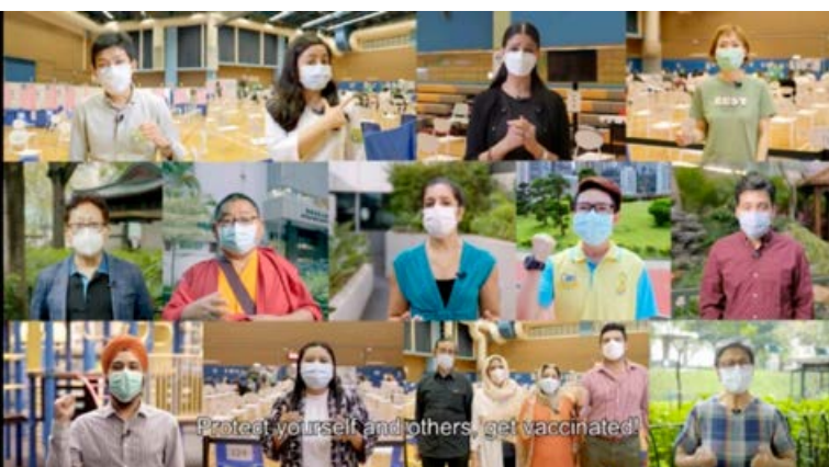
■ 非華裔團體代表參與拍攝短片，呼籲友儕及早接種疫苗，護己護人。

此外，食物及衛生局局長陳肇始教授、衛生署署長陳漢儀醫生及衛生防護中心總監林文健醫生於 7 月，與約 20 個本地非華裔團體領袖及相關服務的非政府組織舉行圓桌研討會，了解他們對向其族群宣傳接種新冠疫苗的意見及看法，共同商討推動計劃。