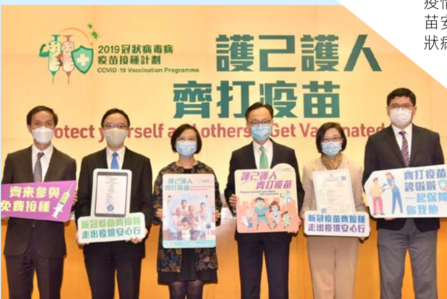
■ 政府於今年2月公布2019冠狀病毒病疫苗接種計劃的具體安排。公務員事務局局長聶德權（右三）、食物及衛生局局長陳肇始教授、衛生署署長陳漢儀醫生（右二）、醫院管理局行政總裁高拔陸醫生（右一）、政府資訊科技總監林偉喬（左二）及一般職系處長陳信禧（左一）出席記者會並合照。

為持續監察新冠疫苗的安全性，接種後出現異常事件的報告，會交予由衛生署成立的新冠疫苗臨床事件評估專家委員會進行獨立評估，判斷是否與疫苗使用