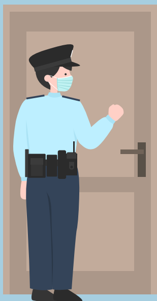
Pemeriksaan di Tempat