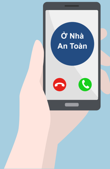
Gọi điện thoại