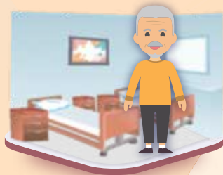
居於護理院舍的人士