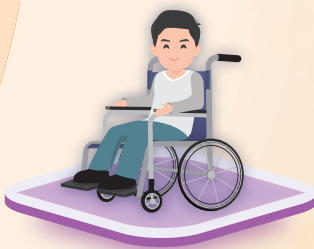
有長期健康問題的人士▲