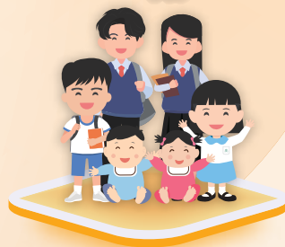
6個月至未滿18歲兒童及青少年