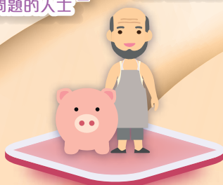
從事養豬和屠宰豬隻行業的人士