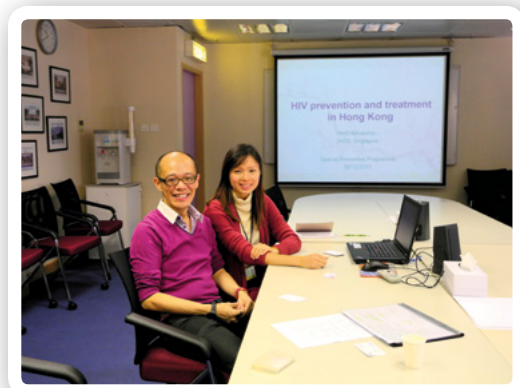
一位新加坡代表於12月2日參觀紅絲帶中心