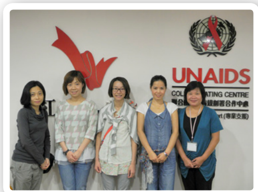
於10月13日接待來自中國的愛滋病臨床護理學人