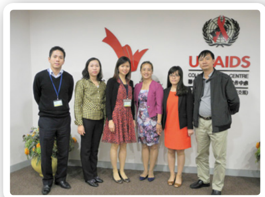
四名來自越南衛生部及財政部的代表於11月14日參觀紅絲帶中心

紅絲帶中心接待來自中國內地及澳門機構的訪客，提供平台以加強本港與海外人士在愛滋病防治工作上的合作。二零一三年的訪客人數共有306位。